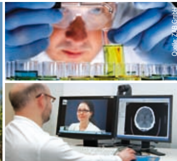
Best-Practice-Beispiele: Die Panta Rhei gGmbH mit dem Forschungszentrum für Leichtbauwerkstoffe an der Brandenburgischen Technischen Universität Cottbus und die MEYTEC GmbH, Spezialist für Telemedizin aus Werneuchen.

Der Europäische Fonds für regionale Entwicklung (EFRE) ist ein wichtiges Instrument, um Investitionen in Innovationen anzuregen. Brandenburg erhält seit 1991 EFRE-Mittel. Diese tragen zur Steigerung des Einkommens- und Beschäftigungsniveaus bei und stärken so die regionale Wettbewerbsfähigkeit. EFRE-Mittel sollen dem Land helfen, zu den wirtschaftlich erfolgreichsten Regionen der Europäischen Union aufzuschließen.