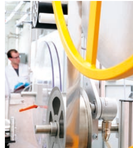
Nachhaltige Förderung für modernste Solarzellen mit hohem Wirkungsgrad.

Somit werden die Landesmittel mit der EFRE-Förderung finanziell verstärkt. Eine Förderung steht grundsätzlich allen Zielgruppen offen. Zu jedem Förderprogramm gibt es Vorgaben, wer eine Förderung beantragen kann.